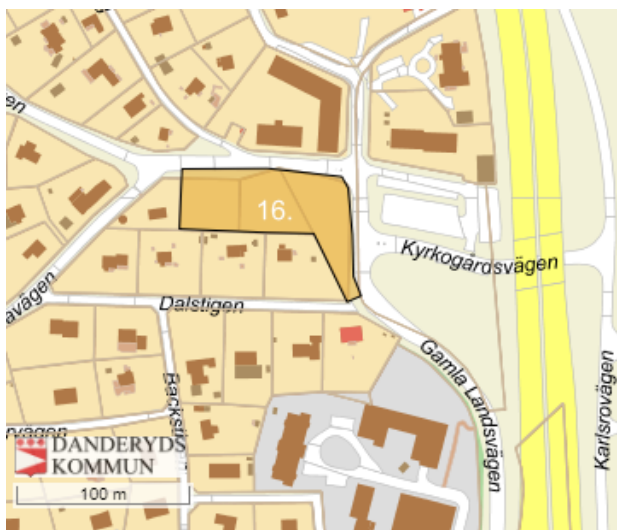
Figur 1: Karlshäll 2 och 3 samt Danderyd 3:96, Korsningen Noragårdsvägen/Gamla Landsvägen (Danderyd)

Samhällsutvecklingsförvaltningen Lukas Kvarfordt