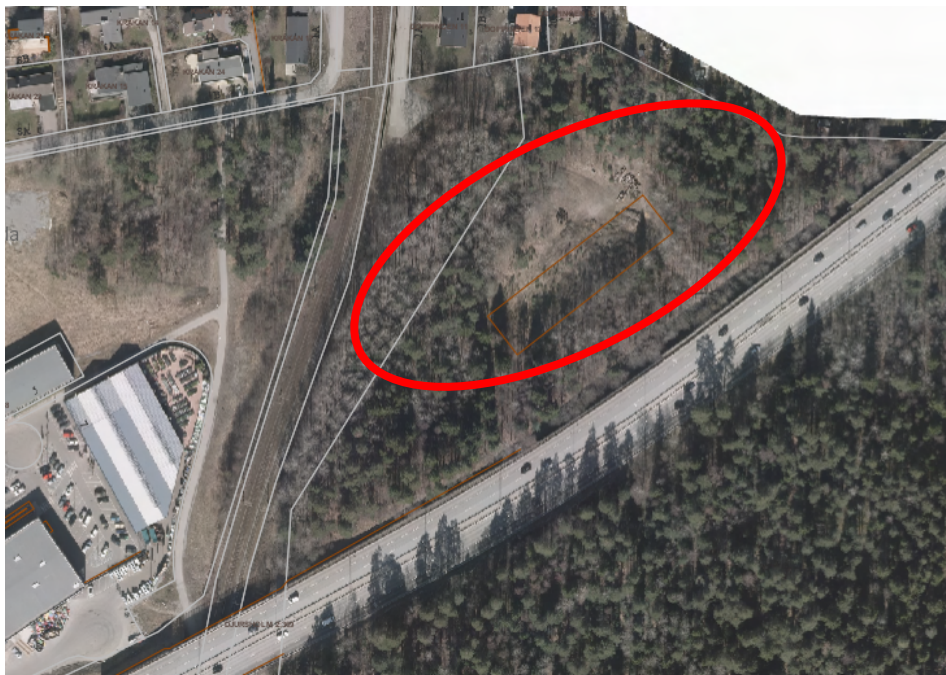
Aktuellt område öster om Roslagsbanan

Behovet av studentlägenheter är mycket stort i hela Stockholms län.