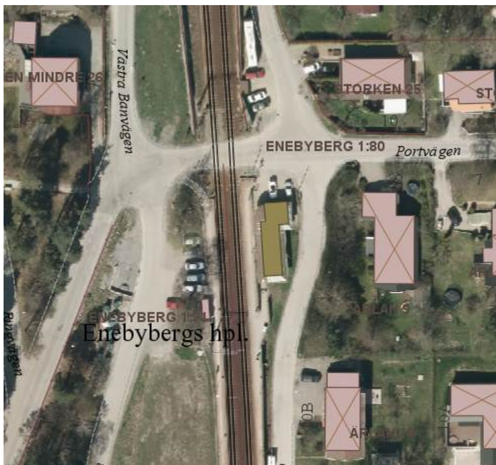
Enebybergs station med befintlig överfart.

Under åren har flera olyckor i befintlig plankorsning Roslagsbanan – Portvägen i Enebyberg inträffat. År 2004 inträffade en olycka med två döda som följd och 2011 inträffade ytterligare en olycka med ett dödsfall som följd.