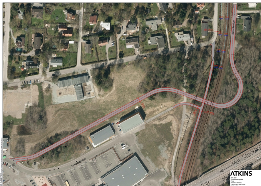
En möjlig sträckning för planskild korsning söder om Östra Banvägen

Ärendet angående planskild korsning med Roslagsbanan och möjlig vägdragning har länge diskuterats inom kommunen. Vid sitt sammanträde 2014-06-09 beslutade kommunstyrelsen att bordlägga ärendet om detaljplan för planskild korsning. Vid sitt sammanträde 2015-01-12 beslutade Kommunstyrelsen att återremittera ärendet till kommunledningskontoret för ytterligare beredning.