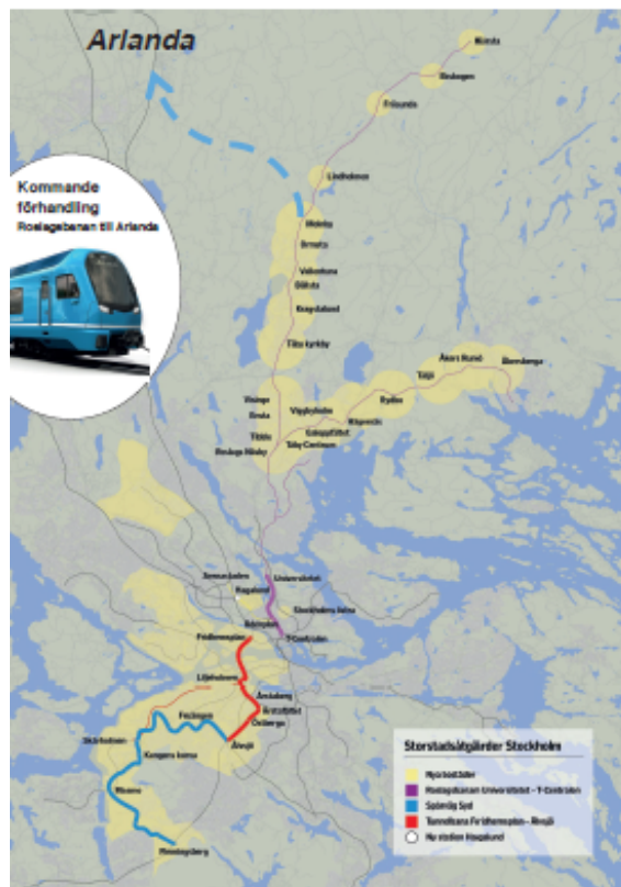
Bearbetning av bilder från Sverigeförhandlingen och Stockholms läns landsting

Stockholm Nordost vill i sammanhanget påpeka att även stationerna på Roslagsbanan ska redovisas på plankartan.