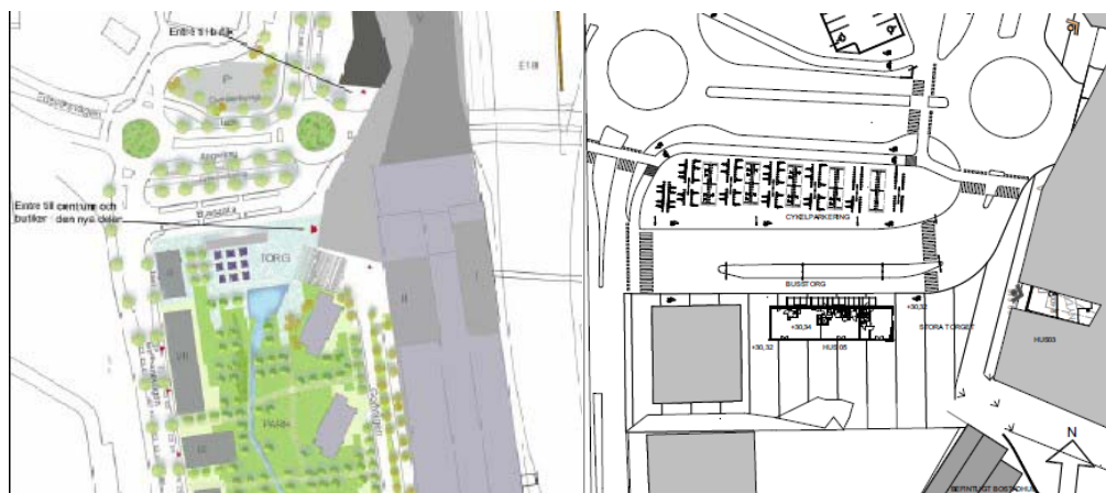
Illustrationsplan i detaljplanen

Den uppförda bussgatan överensstämmer inte med detaljplanens illustrationsplan och intentioner. Bussgatan ligger betydlig närmare paviljongen och den så kallade Kulturbyggnaden och inskränker till mindre del på byggrätten för paviljongen och strider mot planens intentioner. Det innebär att en justering/flytt av bussgatan måste ske vid genomförande av paviljongen.