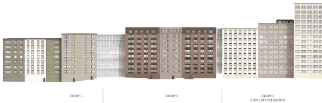
Illustration (inkom 2021-10-18)

Fasaderna delas upp i olika sektioner med olika putsstrukturer och tegel, kulörer och detaljer som bidrar att minska den visuellt stora skalan. Balkongerna placeras mot den tysta sidan mot gården.