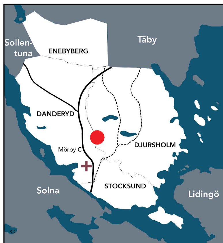
● Planområdets läge i kommunen

Information En planändring har gjorts. Planbestämmelser från 1961 fortsätter att gälla tillsammans med den planändring (tillägg av minsta fasthetsstorleksbestämmelser) som redovisas i denna plankarta.