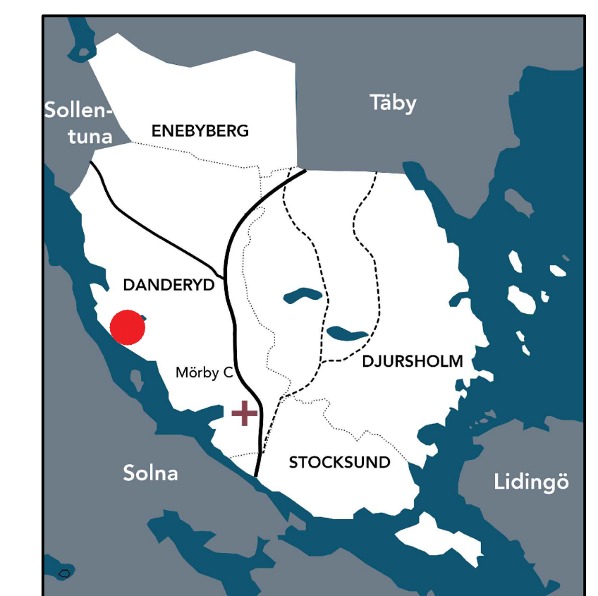
● Planområdets läge i kommunen

Genomförandetiden är 5 år från det datum planändringen får laga kraft.