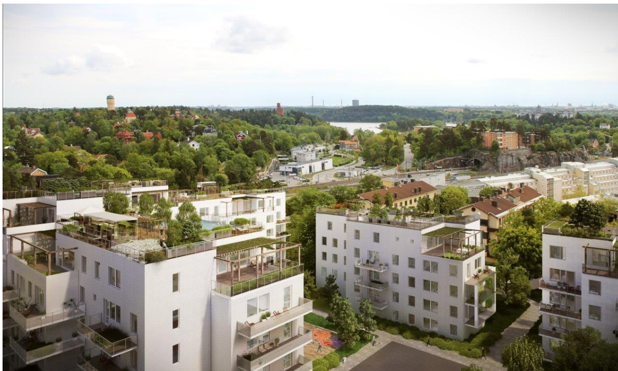
Utsikt mot sydostfrån befintliga flerbostadshuset på fastigheten Sjukhuset 17, Mörbylund 7-15. Illustration från Ettelva Arkitekter.