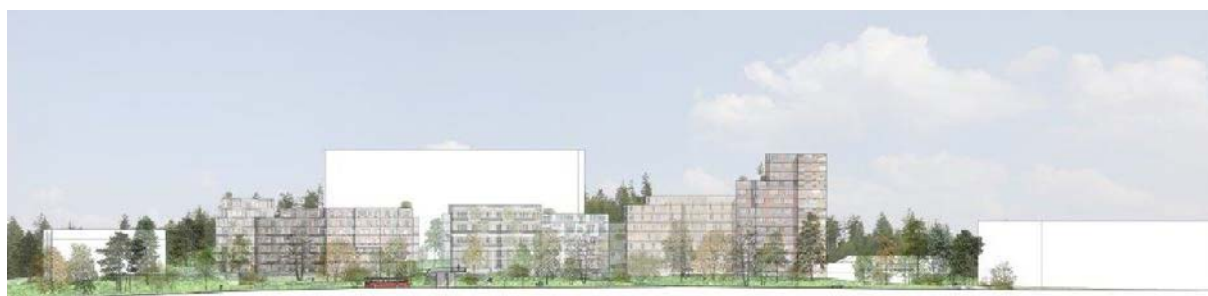
Siluett/section sett från öster. Material från Ettelva Arkitekter.