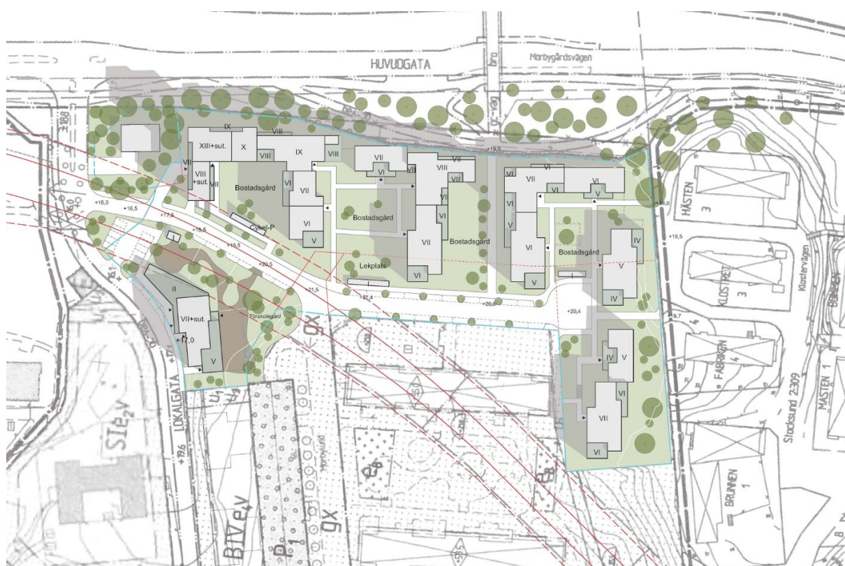
Illustrationsplan. Material från Ettelva Arkitekter.

Omkring 70 av lägenheterna förväntas bli studentbostäder eller mindre ungdomslägenheter.