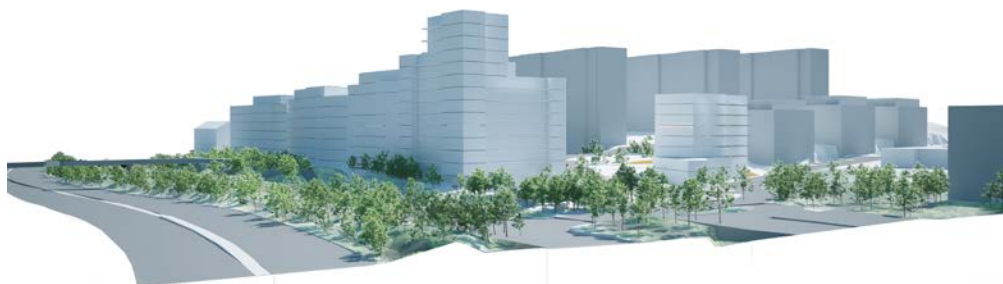
Volymstudie, sett från nordost. Material från Ettelva Arkitekter.

Områdets utformning bygger på en varierad höjdsättning där områdets södra delar och gårdshus får en lägre bebyggelse och där huskropparna i norra delen av planområdet och närmast E18 tillåts vara högre. Indragna takvåningar och en variation av fasadlivet skapar en attraktiv boendemiljö med större takterrasser och en mer varierad och attraktiv siluett.