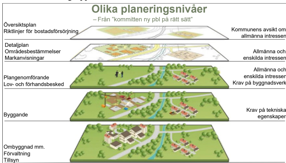
Bild ovan: Olika planeringsnivåer.

Utöver bostadsförsörjningslagen finns lagar som främst berör socialtjänstens områden. Det som lagarna sammanfattningsvis påvisar är att kommunen ansvarar för att planera bostadsförsörjningen, genomföra översiktlig planering och detaljplanering, utfärda och kontrollera bygglov och byggande samt anta riktlinjer för markanvisningar i kommunen. Enligt lagstiftningen har kommunen också ett särskilt ansvar för att ordna boende åt särskilt utsatta grupper.