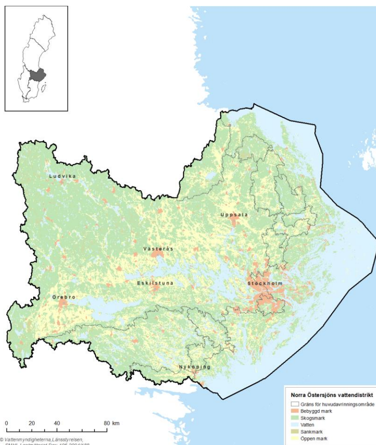
Figur 1. Norra Östersjöns vattendistrikt sträcker sig från Dalälven i norr till Brävikensån i söder, från Kilsbergen i väster till skärgården i öster.

På varje vattenmyndighet finns en vattendelegation som är utsedd av regeringen. Arbetet bedrivs i 6-årscykler och i slutet av varje cykel beslutar vatten-delegationerna om förvaltningsplan, åtgärdsprogram och miljökvalitetsnormer. Vattenmyndigheterna delegerar till länsstyrelserna i respektive distrikt att ta fram nödvändiga underlag till dessa beslut, till exempel att klassificera status i samtliga vattenförekomster.