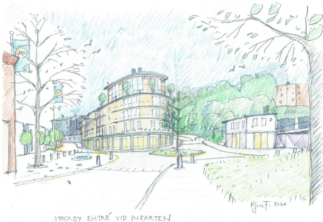
Skissad vy mot söder som visar föreslagen bebyggelse, Kjell Forshed, 2020