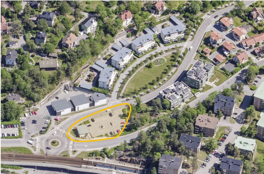
Planområdet från nordväst