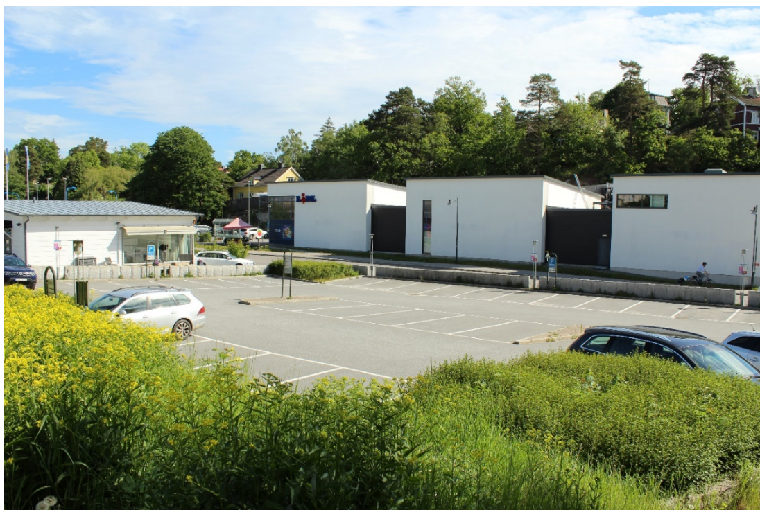
Planområdet sett från Bengt Färjares väg.

Utanför området, direkt söderut, ligger en träd- och vegetationsbevuxen yta (med användningen PARK i gällande detaljplan) som är en naturlig och viktig avgränsning med grönska mellan aktuellt område och bebyggelsen söderut. Ovala parken är belägen sydost om området. Parken består av större klippta gräsbevuxna partier, planteringar och lindar som ramar in parken. Trots att området i norr närmast E18 präglas av trafiklösningar som upplevs det ändå som lummigt och grönt i synnerhet in mot Ovala parken.