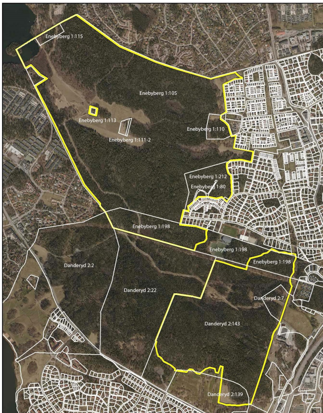
Karta 2. Beslutskarta Rinkebyskogens naturreservat