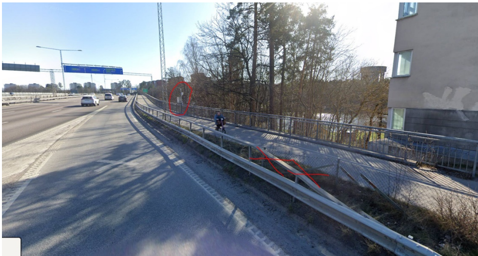
Figur 2. Röd cirkel befintlig väderstation, röda kryss ny lokalisering för väderstation