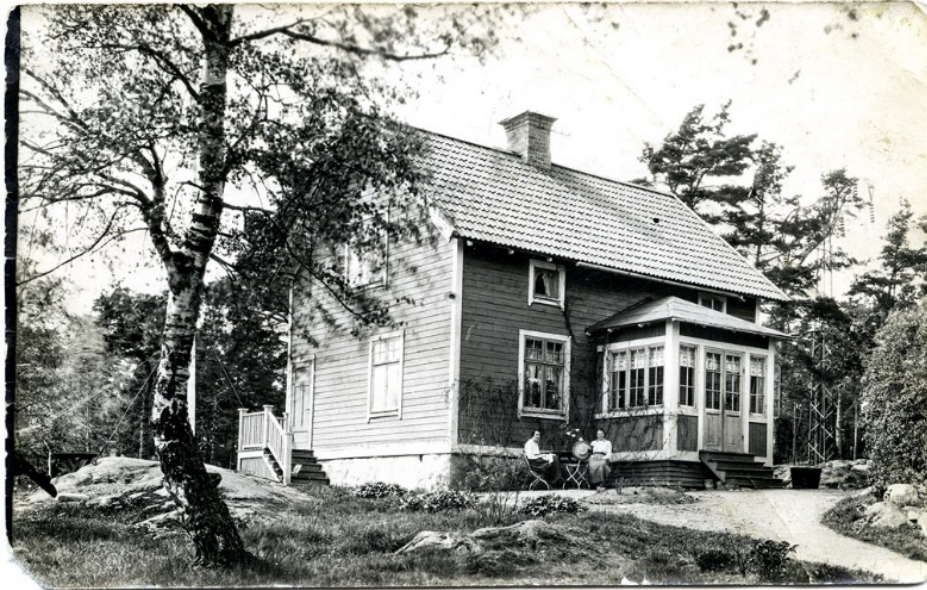
Illustrationer 1. Äldre foto på Oskarsborg.

Det är troligt att byggnaden förvärvades för att underlätta en tilltänkt exploatering av området. Det har heller inte funnits någon kommunal verksamhet i huset. Man kan anta att det är en bakomliggande orsak till att underhållet nu är kraftigt eftersatt. Takavvattningen brister då hängrännor antingen saknas eller är genomrostade. De allvarligaste skadorna är sättningar i stomme och grund samt rötskador på bottensyllar. Skorsten, tak, fasad och fönster är i behov av renovering.