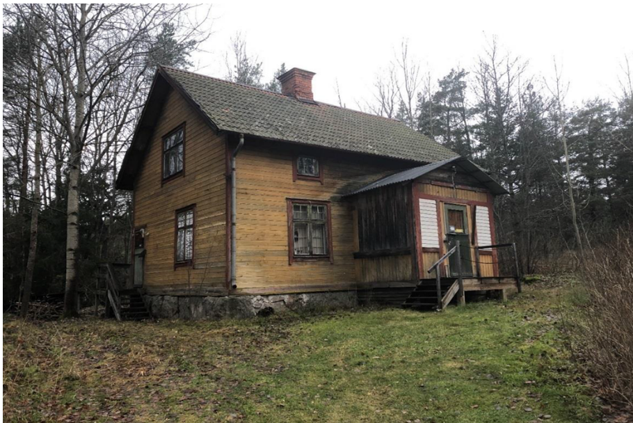
Illustration 2. Foto från 2019.

Visst missnöje beträffande byggnadens skick har framförts av allmänheten och den 2 november 2021 har ett formellt klagomål inkommit till miljö- och stadsbyggnadskontoret gällande bristande underhåll av Oscarsborg. Efter platsbesök den 16 november 2021 konstaterade miljö- och stadsbyggnadskontoret att underhållet av byggnaden är kraftigt eftersatt. Ett ärende om föreläggande är under beredning till byggnadsnämnden.