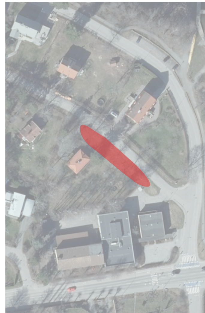
Inringat område visar alléns utsträckning.