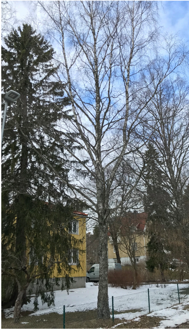
Träd nr. 4.