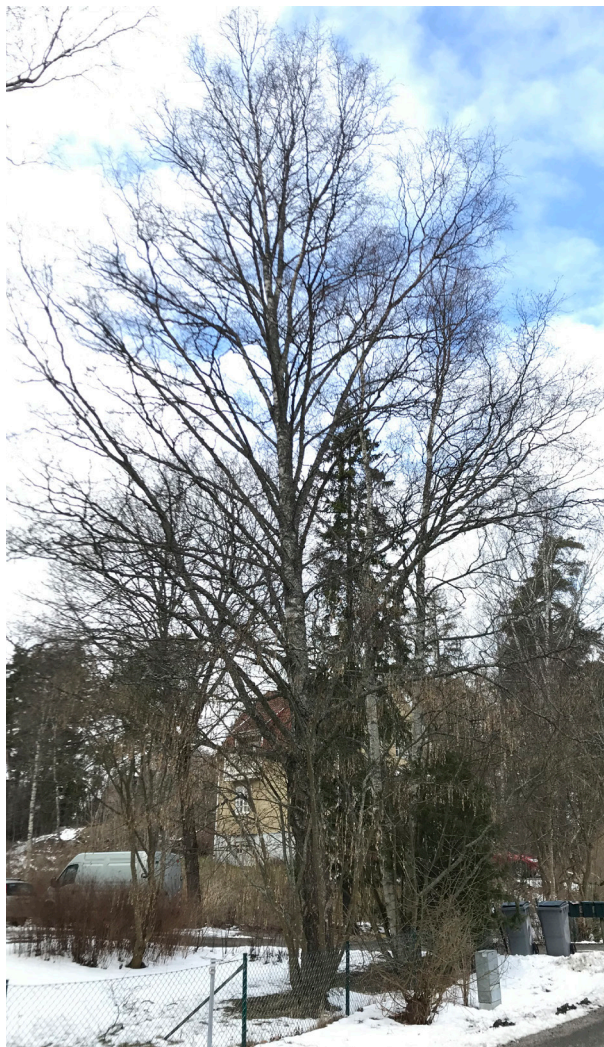
Träd nr. 5.