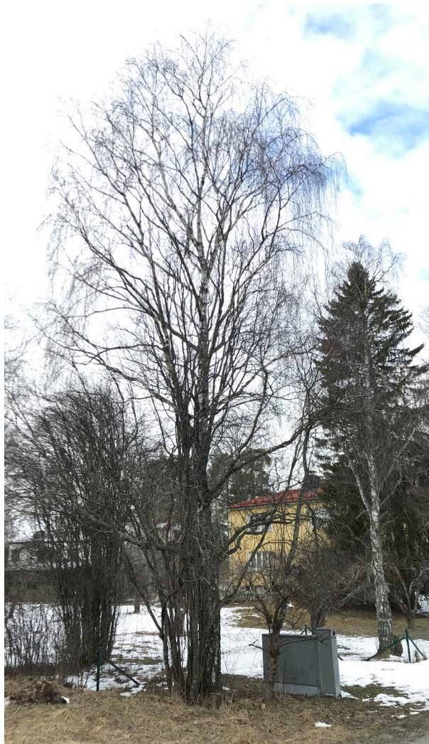
Träd nr. 1.