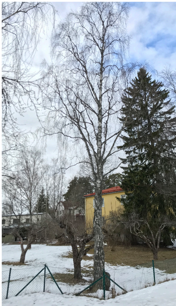
Träd nr. 2.