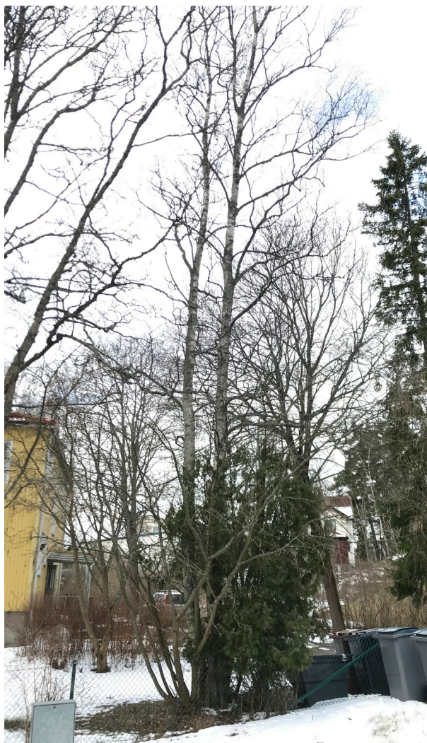
Träd nr. 6.