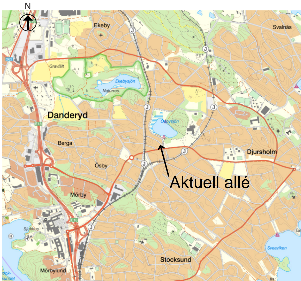
Geografiskt läge.