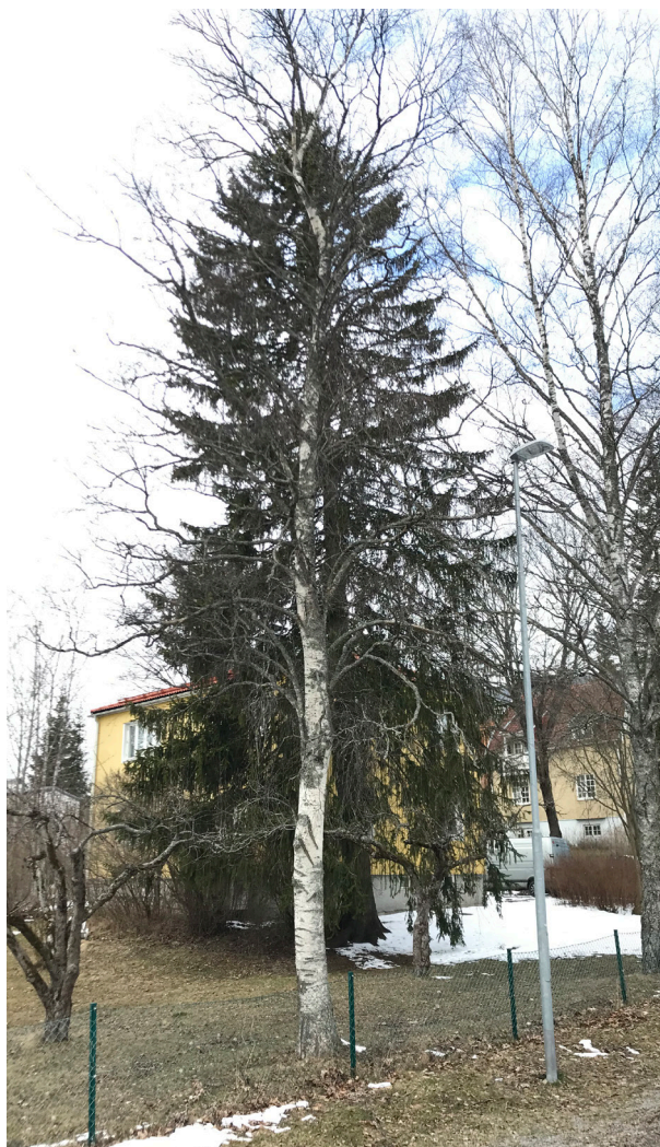
Träd nr. 3.