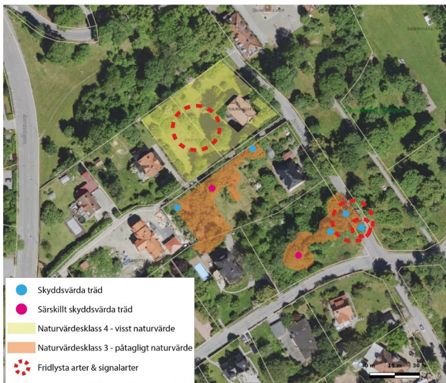
Naturvärdeskarta över området.

I samband med fältstudien avgränsades även sju värdeelement i form av värdefulla träd. Fem av dessa bedömdes utgöra skyddsvärda träd och två bedömdes utgöra särskilt skyddsvärda träd . Inom Grotte 1 finns ett särskilt skyddsvärt träd samt tre skyddsvärda träd . Av dessa är tre av arten ask, en av dessa är särskilt skyddsvärd, samt en lind. Ask är en rödlistad art som bedöms som starkt hotad.