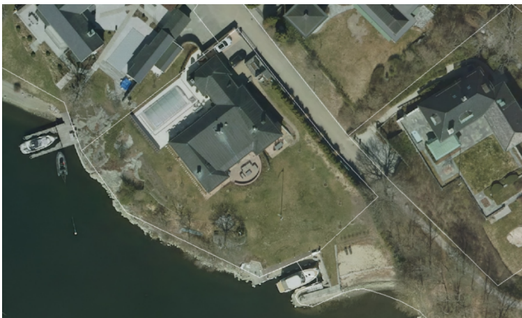
Flygbild på bryggan 122 med fastighetsgränsen för Kraka 3.

Hamnanläggningen har sedan en längre tid disponerats av fastighetsägaren till Kraka 3, som även tagit intilliggande parkmark i anspråk. Det annekterade området har stängslats in och planterats med buskar och träd. Det innebär att en större del av parkmarken inte är tillgänglig för allmänheten och att hamnanläggningen inte heller syns från den allmänna stigen som leder genom grönområdet.