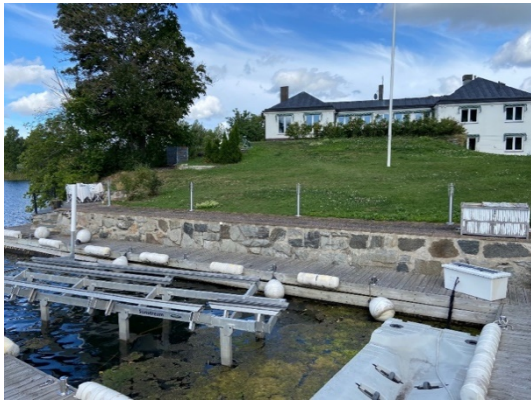
Hamnanläggningen. Foto från 2023.