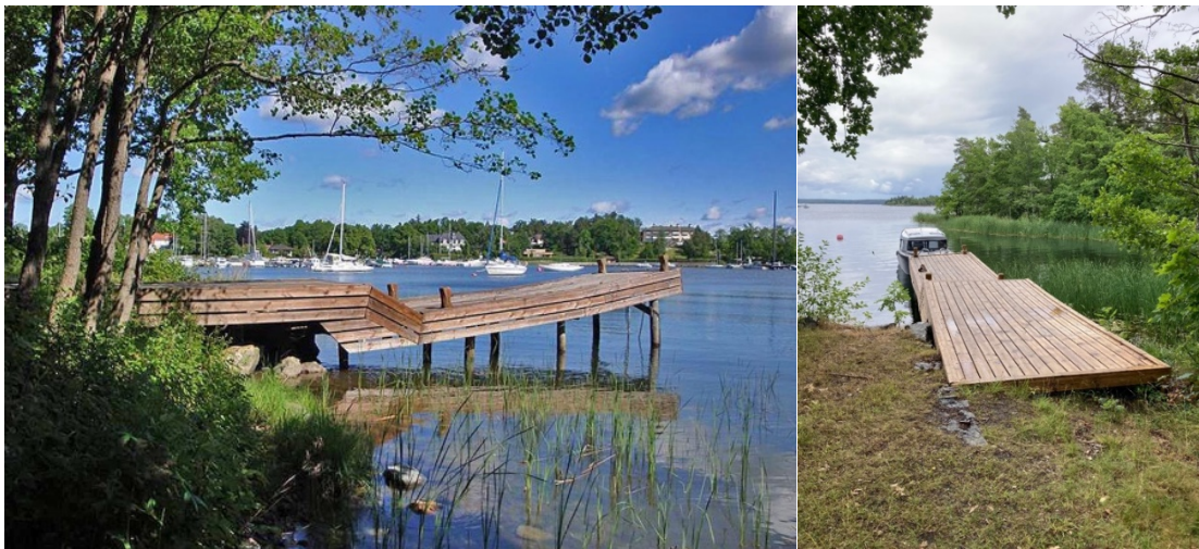
Brygga 123. Foto från 2009 och 2023.

Enligt kommunens va-avdelning kommer bryggan att tas bort i samband med att en tryckavloppsanläggning föreslås få sin lokalisering till platsen.