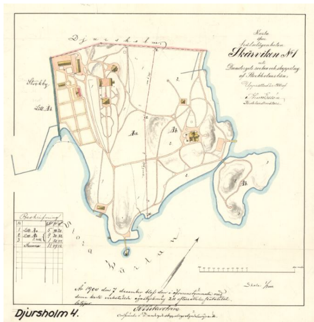
Karta från 1900 över den ägostyckning som skedde av fränselägenheten Skärviken nr 1.