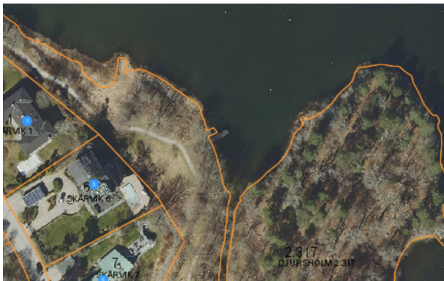
Flygbild som visar brygga 123 och fastigheten Skärvik 6.