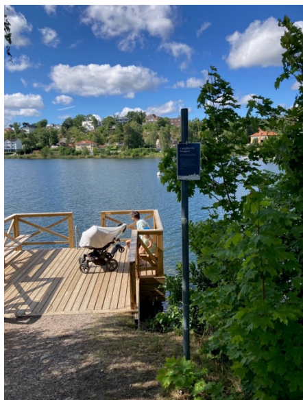
Foto från 2023. Provisorisk skylt uppsatt i juli 2023 i avvaktan på nytt skyltställ.