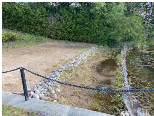
Annekterat strandparti i anslutning till hamnanläggningen. Foto från 2023.

MoSP har muntligt presenterat detta bryggfall på kommunstyrelsens fastighets- och exploateringsutskotts sammanträde den 11 december 2023. Förvaltningen fick då i uppdrag att återta den annekterade marken och fortsätta arbetet med att träffa avtal med fastighetsägaren avseende vattenområdet med hamnanläggningen. Tekniska kontoret, anläggningsavdelningen har därefter fått i uppgift att ta fram en plan för hur markområdet ska iordningställas. Det arbetet pågår.