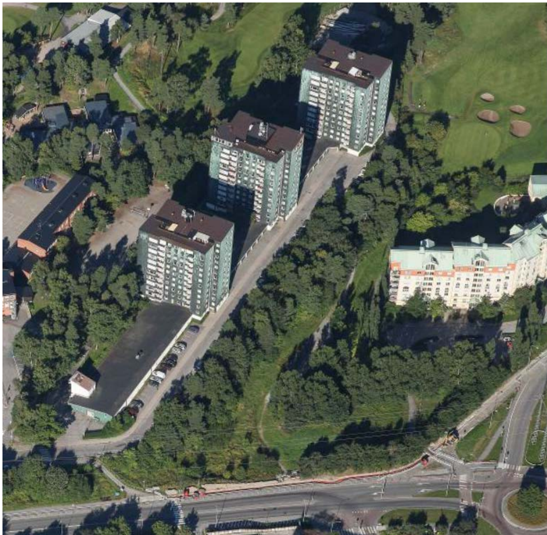
Kvarteret Vågen (kopparhusen) och fastigheten Väduren 1 (Kevinge seniorboende). Vy mot väster.

Marken utgörs av postglacial lera och urberg i större delen av området. Inga kända fornlämningar finns i området.