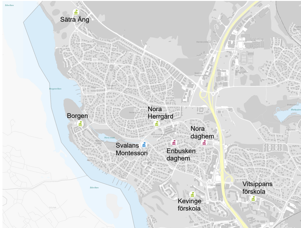
Fig. 2 Förskoleverksamheter i Västra Danderyd (gröna är kommunala)

Samhällsutvecklingsförvaltningen Fredrik Lindberg