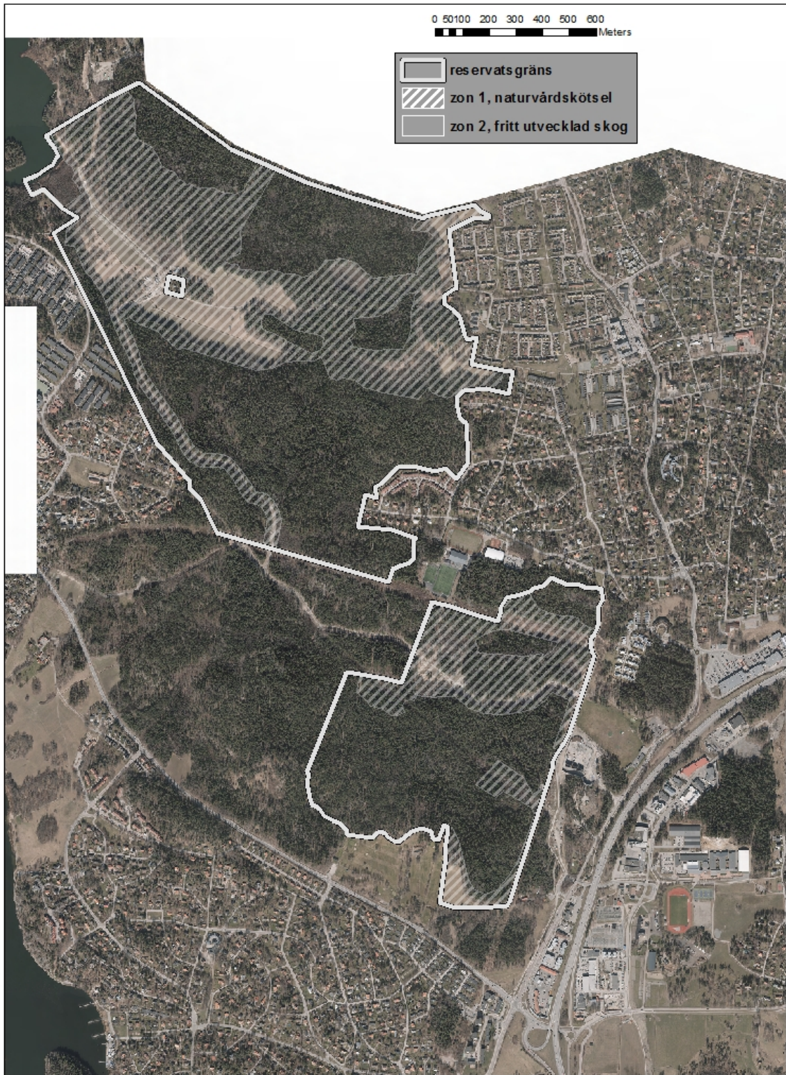
Karta 6. Indelning av skötselzoner