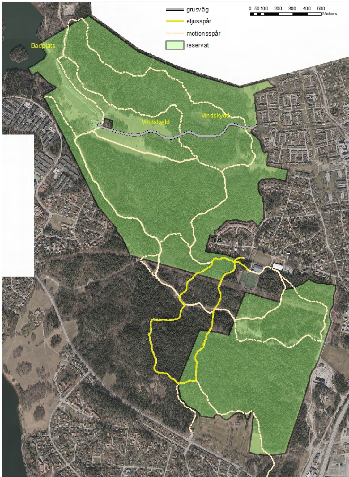
Karta 5. Motionsspår, grusväg, vindskydd och badplats i Rinkebyskogen.