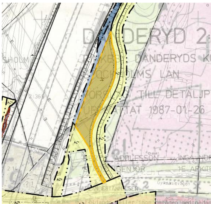
Figur 3: Avvikelseområde för busstrafik i norrgående riktning. Inskränkning av vägrätten sker där detaljplan anger grönområde/gatuplantering och arbetsplanen anger område för dike och avvattning (orange markering).

I figur 3 anges de ytor där vägrätten kommer att inskränkas (orange markering). Dessa ytor är i arbetsplanen planerade för dike och avvattning. Denna inskränkning antas inte utgöra en betydande användningsmässig avvikelse gentemot vad som är bestämt i detaljplanen eller hur ytan nyttjas idag.