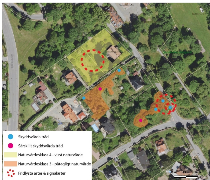
Naturvärdeskartan över området.

I samband med fältstudien avgränsades även sju värdeelement i form av värdefulla träd. Fem av dessa bedömdes utgöra skyddsvärda träd och två bedömdes utgöra särskilt skyddsvärda träd . Inom Grotte 1 finns ett särskilt skyddsvärt träd samt tre skyddsvärda träd . Av dessa är tre av arten ask, en av dessa är särskilt skyddsvärd, samt en lind. Ask är en rödlistad art som bedöms som starkt hotad.