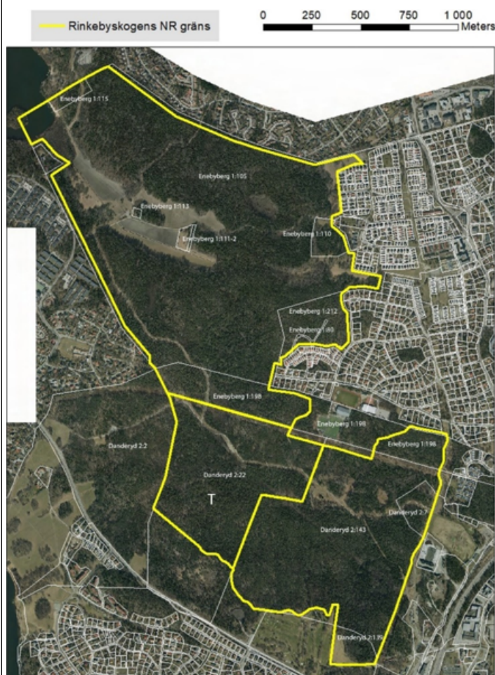
Karta 2. Beslutskarta med det tillagda området för Rinkebyskogens naturreservat del av Danderyd 2:22 markerat med T.