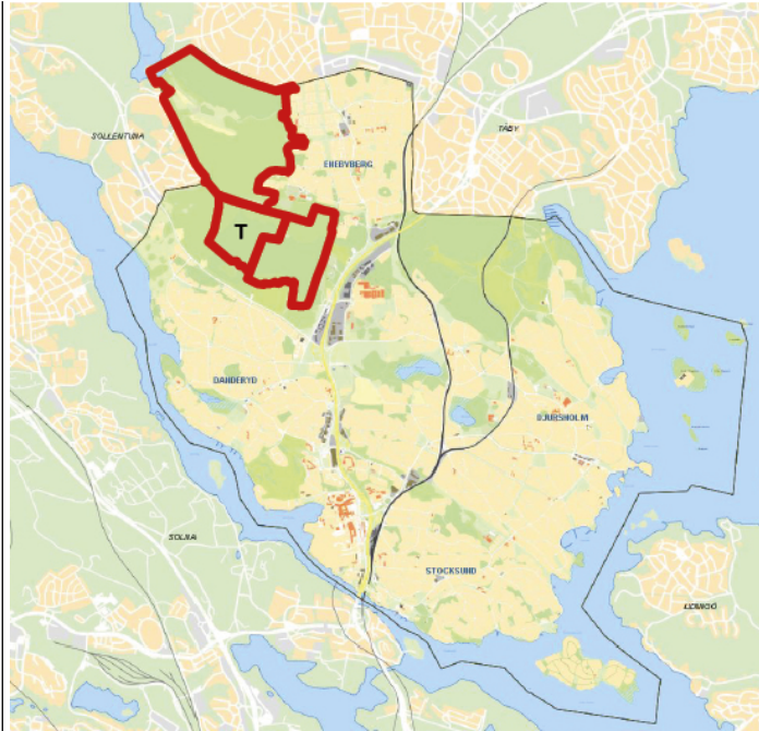
Karta 1. Rinkebyskogens naturreservat, läge i Danderyds kommun, med tillagt område markerat som T.