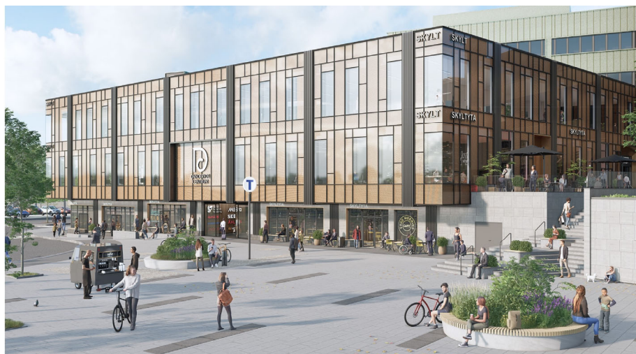
Bild från norra torget