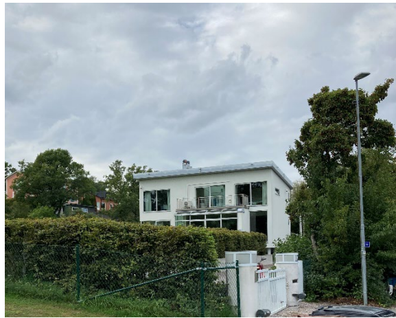
Byggnad inom Urd 21.