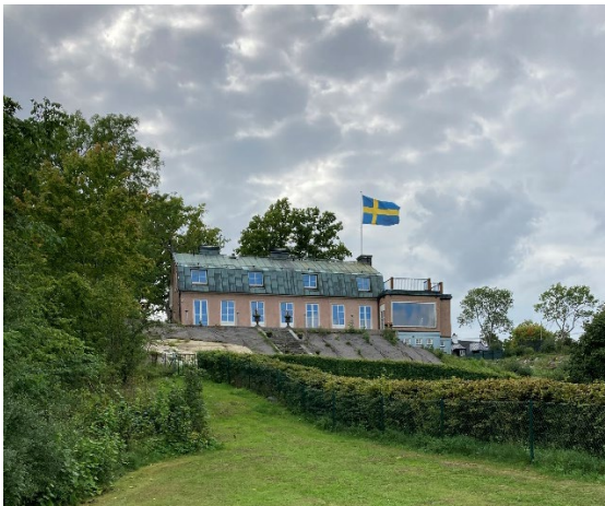
Byggnad inom Urd 22.

Bostadshuset inom Urd 21 byggdes 2003 och har en byggnadsarea på ca 201 kvadratmeter och är uppförd i två våningar.