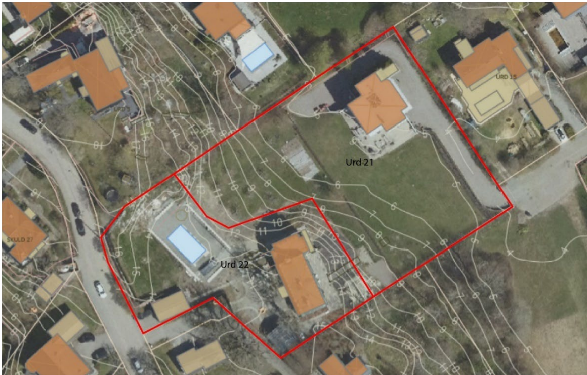
Urd 21 och 22 med höjdkurvor.

Jordlagret inom Urd 22 består mestadels av morän och urberg och inom Urd 21 av postglacial lera. Urd 22 ligger marknivåmässigt högre upp än Urd 21 och fastighetsgränsen mellan dem går delvis mitt i en slänt.