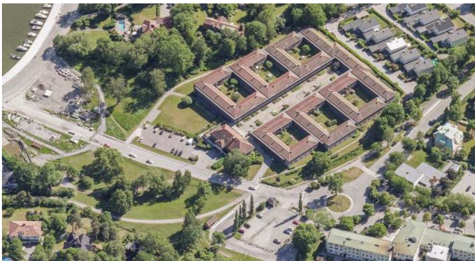
Flygfoto mot söder.

Bostadsrättsföreningen bildades 1974 och beskrivs av föreningen själv som en +55-förening.